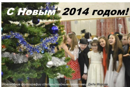
Новогодние фотографии сделаны тайными агентами Деда Мороза