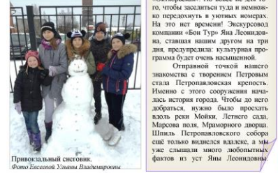
Привокзальный сувенирик.

Да, мне нравится в этом необыкновенном городе по-другому. Я всегда в восторге от встречи с ним. Видимо, он тоже радовался моему прибытию, предостерега нас до подарка: солонечку, безвредную погоду и отсутствие «пробок». Комфортабельный экскурсионный автобус быстро доставил нас в окрестный центр к гостинице «Октябрьская». Но новсе не до того, чтобы заскитаться туда и немоволодому номерам. Осталось совсем немного, и мы окажемся в окружении разноразличных интересных людей. Мыслью хочется дышать воздухом северной Финляндии.