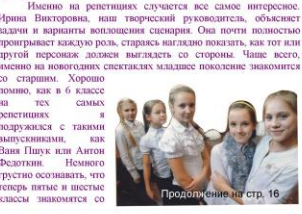
Продолжение на стр. 16