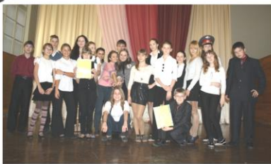
Участники, организаторы и жюри игры «Правовая дистанция»

Внимание! Редакция не имеет никакого отношения к публикуемым материалам и никогда не согласна с позицией авторов!