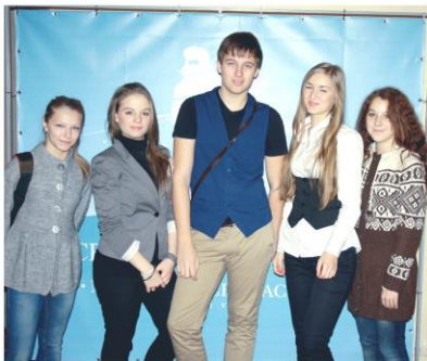
Гимназисты на фестивале

С 14 по 18 ноября в Мурманске состоялся IV Международный фестиваль документальных фильмов и телевизионных программ «Северный характер». Все мероприятия фестиваля проходили в отеле «Парк Инн Полярные Зори».